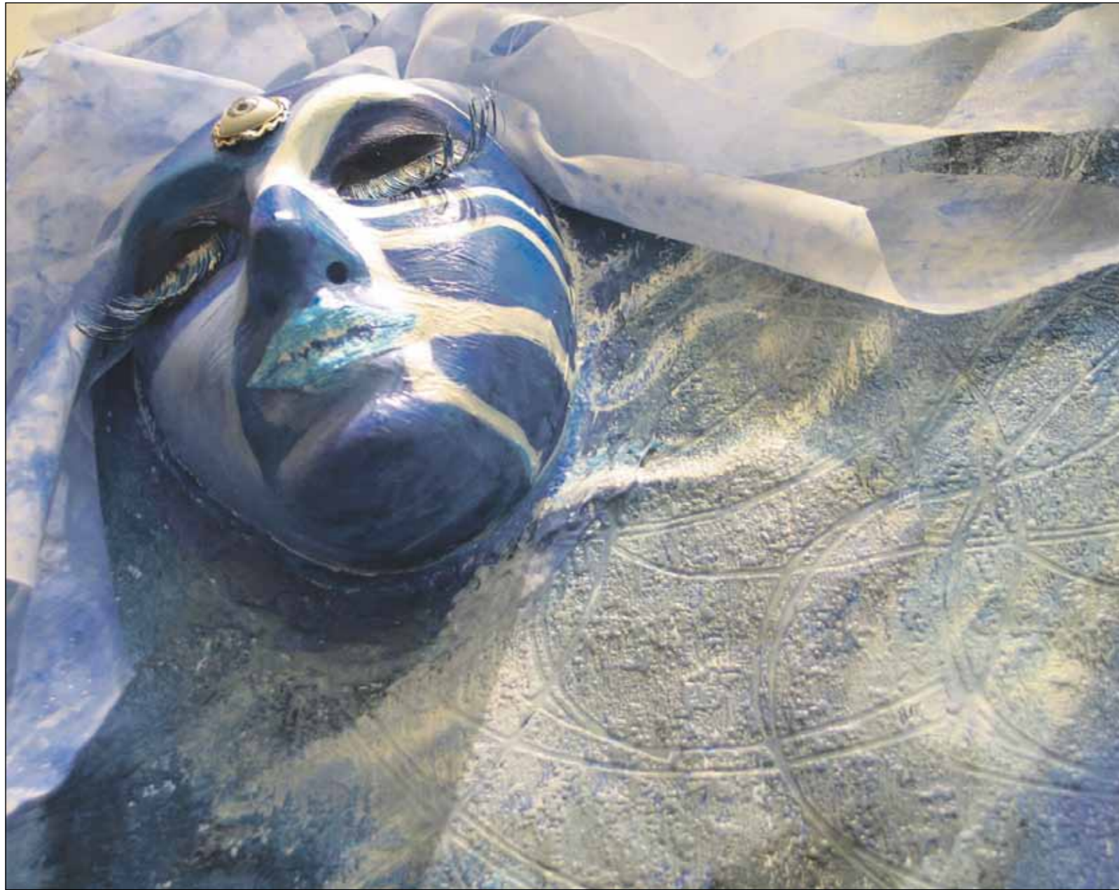
Kuvataiteella on Ylöjärven työväenopistossa vankka jalansija. Tässä näyttävä yksityiskohta viime keväältä, tekijänä Elina W.

Tälle syyskaudelle on haettu erillisrahoitusta myös kokonaisten hankkeiden toteuttamiseen. ALVA – Aikuisen taidekasvatusta yli rajojen -projekti pyöri jo toista vuotta. Siinä