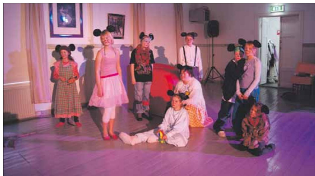
Viljakkalan Nuorisoyhtymä esittää joka vuosi uuden lastennäytelmän. Viime projektissaan lapset ja nuoret paneutuivat tunnettuun kansansatuun Tuhkimoon.

Balettikoulu Hannele Suomalaisen numero on 03 3441 370, ja Näpsä-käsityökoululle saa soittaa numeroon 03 225 1417. ■