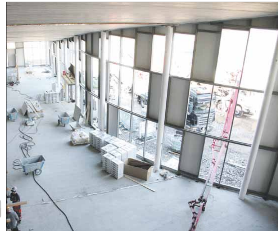
Koulutuskeskuksen suunnittelun johtajajatkusena on ollut yhteisöllisyys. Tulevaan aulaan avautuvat ruokala, kahvio, kirjasto ja käytävät.

– Samat tukimuodot ovat käytössä myös esiopetuksessa, Urpiola muistuttaa. ■