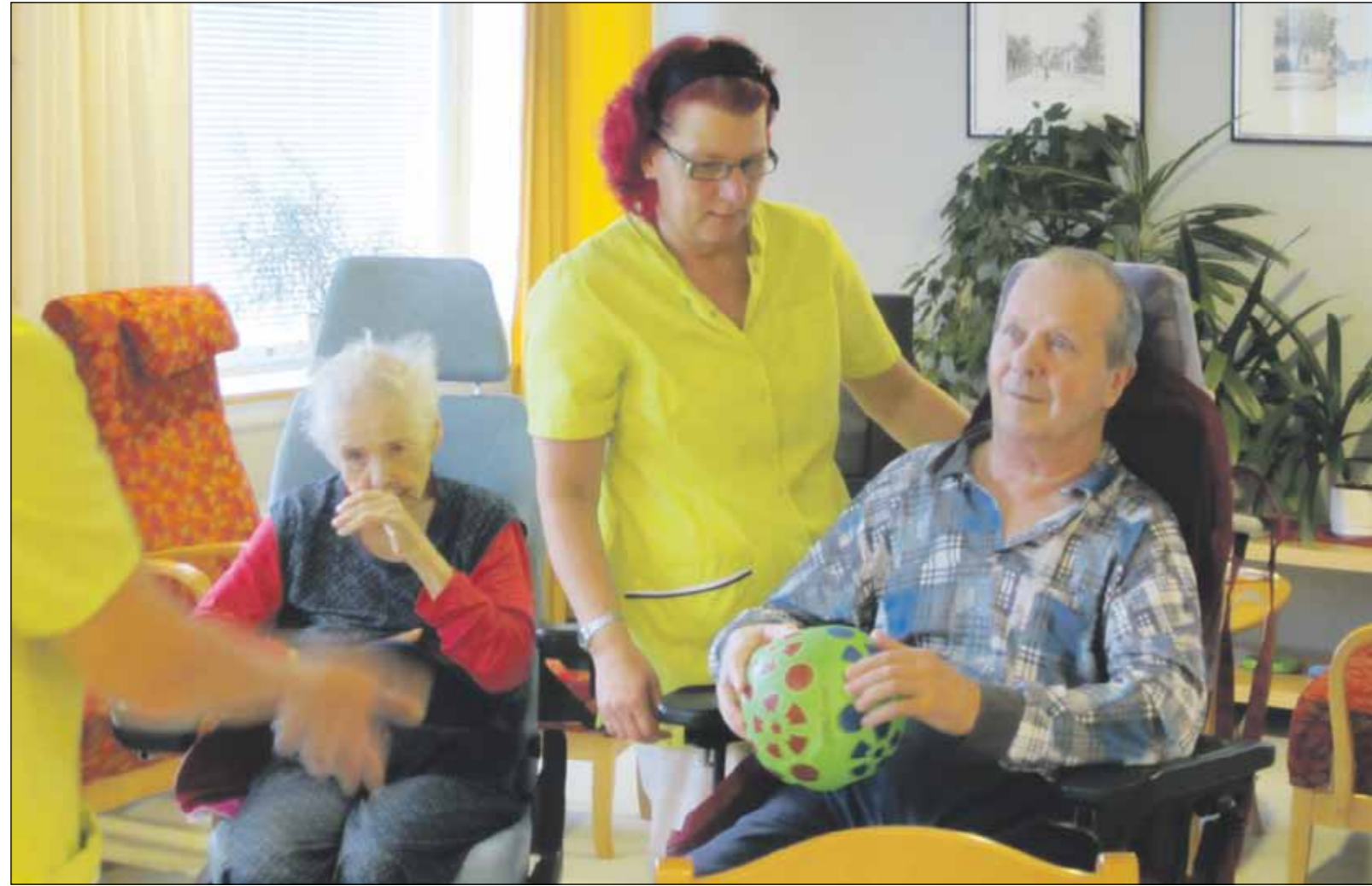
Virkikkeet tuovat iloa jokaisen ihmisen elämään. Niihin liittyy yhdessäoloa, hauskanpitoa ja toiminnallisuutta.

– Keräämme omaisilta ja läheisiltä vinkkejä sekä erilaisia näkökulmia virkistystoimin-