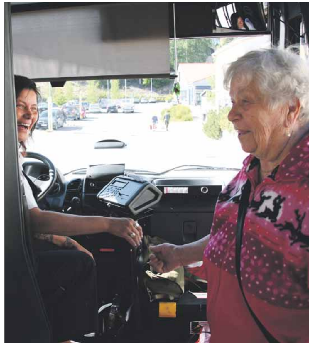
Palvelubusseilla on vannoutuneita käyttäjiä monesta ikäluokasta. Edullisia 2,50 euron kyytejä voivat käyttää kaikki ylöjärveläiset palvelun periaatteiden mukaisesti.

Suunnittelukilpailu ja sen pohjalta laadittava osayleiskaavan muutos koskee osaa Kirkonseudun, Soppeenmäen ja Elovainion alueita.