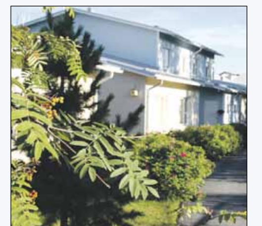
Rakentajien käyttöön on tulossa hyvä tonttivaranto.

Lisäksi myyntiin tai vuokralle asetetaan useita pari-, rivi- ja kerrostalotontteja. Niitä löytyy Kangasniemen, Ojapuiston, Siivikkalan Vasamankaaren ja Soppeenmäen Koulutien alueilta. Lisäksi tontteja avautuu Kirkonseudulla Kultanien ja Kortteen alueilta sekä Turvuontien varrella sijaitsevan vanhan paloasematontin paikalta.