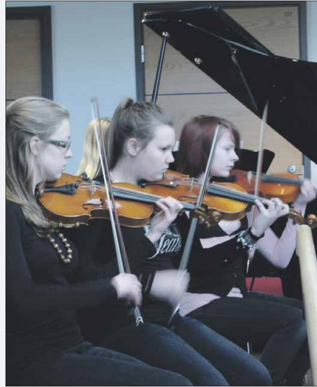
Länsi-Pirkanmaan musiikkiopisto on juhlavuotenaan mukana useassa hankkeessa Pirkanmaan musiikkiopistolaitosten kanssa. Verkostoituminen on päässyt hyvään alkuun.