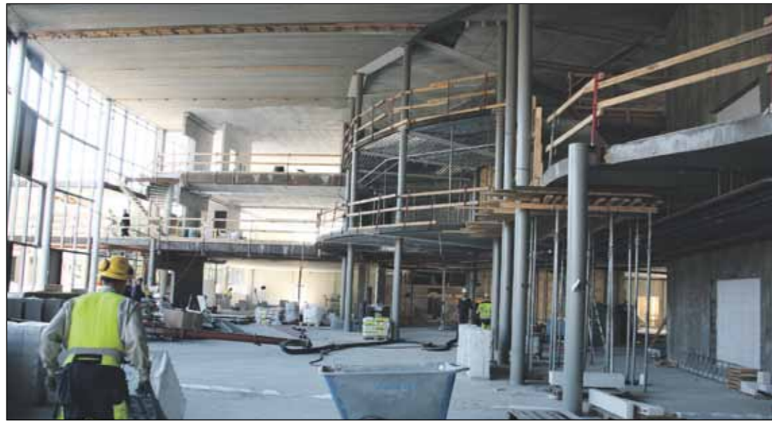
Talouden rattaat jauhavat Ylöjärvellä maailmantalouden kriisikesästä huolimatta. Paikkakunnan historian suurin julkinen rakennushanke, koulutuskeskus, valmistuu ensi vuonna.

Julkaisija: Ylöjärven kaupunki, Kuruntie 14, PL 22, 33471 Ylöjärvi • www.ylojarvi.fi Päätoimittaja: Kaupunginjohtaja Pentti Sivunen