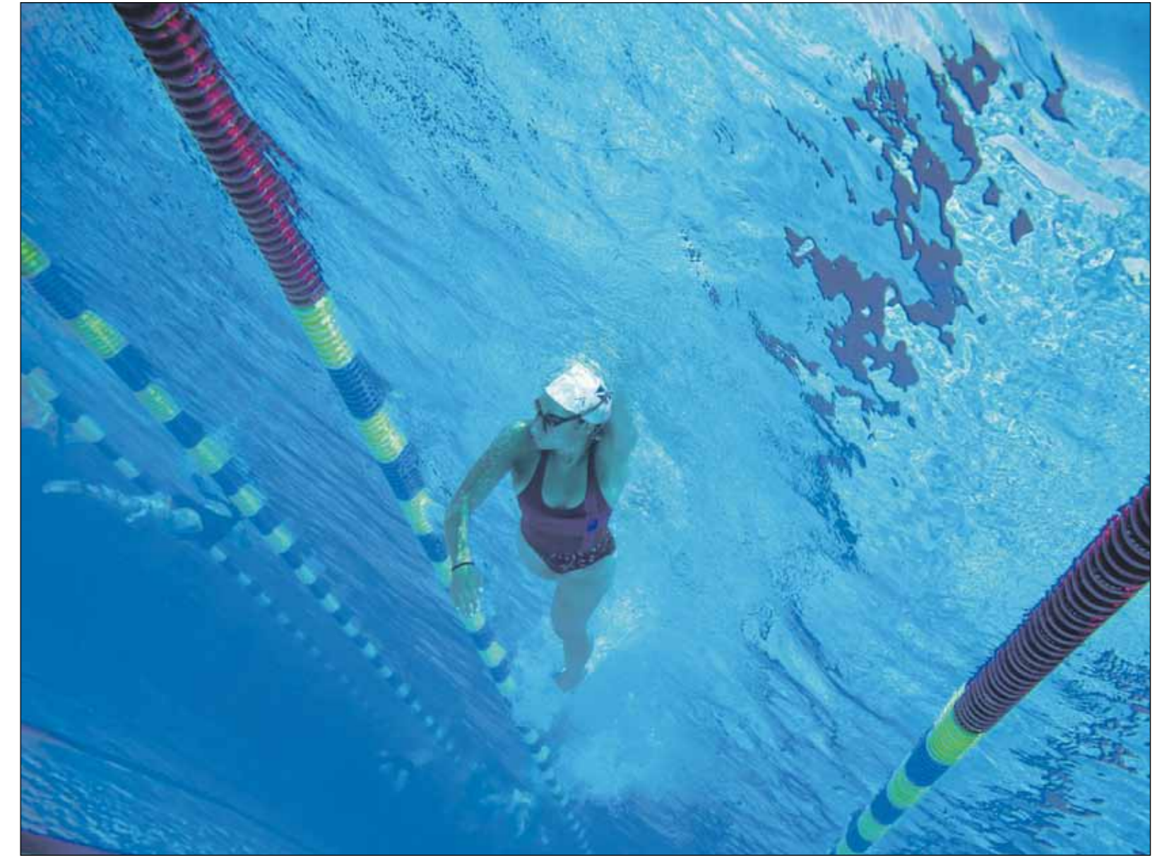
Ylöjärven uimahallissa vieraili esimerkiksi vuonna 2008 peräti 72 400 asiakasta. Hallin kävijämäärä on 2000-luvulla kasvanut huomattavasti.

Urheilutalo toimii tulevana kautena 2011–2012 lähes normaalisti. Toiminnasta tiedote-