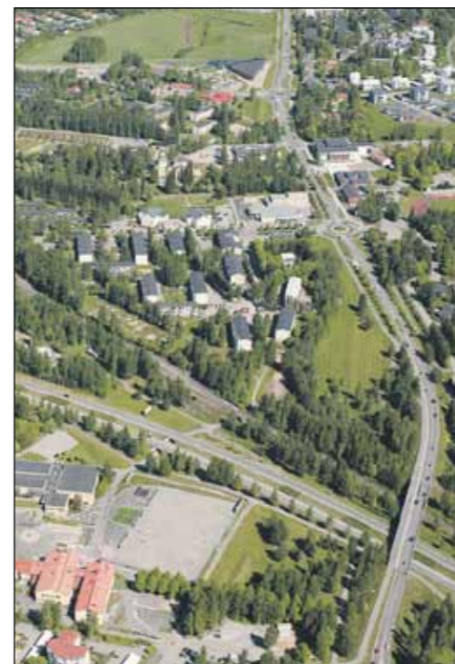
Keskustaa suunnitellaan parhaillaan yli 30 vuoden tähtämällä.

Lisätietoja saa samasta sähköpostiosoitteesta tai puhelimitse numerosta 040 687 8338. ■